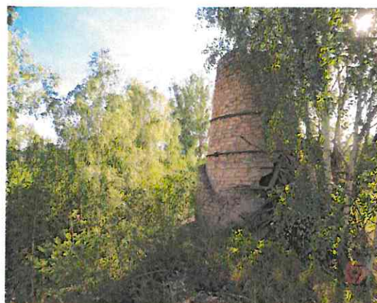
Wapiennik w okolicach Raciszyna

Szczególnym krajobrazem kulturowym w regionie gminy Pajęczno i Działoszyn są obszary odkrywkowej eksploatacji wapieni jurajskich. Wapienniki - to przykład ciekawego, prymitywnego budownictwa przemysłowego do wypalania wapna reprezentującego technologie XIX i początku XX w. Tradycja wypalania wapna w okolicach Pajęczna jest bardzo stara. Być może rozpoczęto tutaj produkcję już w XVII wieku wypalając wapno na budowę nowego kościoła. Zapiski historyczne potwierdzają jego wypał na początku XIX wieku.