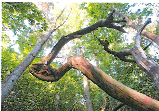
Rezerwat przyrody: „Mokry Las”