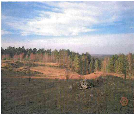
Rezerwat przyrodniczy „Węże”