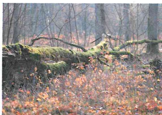
Rezerwat przyrody: „Murowaniec”