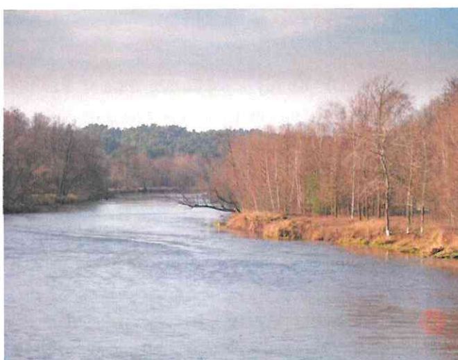
Warta w miejscowości Bobrowniki

Warta przepływa przez park charakterystycznym tzw. Wielkim Łukiem, rzeźbiąc w podłożu głębokie przełomy, pośród jurajskich, wapiennych wzgórz oraz pasm morenowych wzniesień. Dolina Warty jedynie w niewielkim stopniu nosi ślady ludzkiej gospodarki, natomiast koryto rzeki jest całkowicie naturalne, dzikie i piękne, pełne zakoli, meandrów, wysp, wysepek i piaszczystych łąk. Obok walorów krajobrazowych znajdują się tu również unikalne wartości przyrodnicze. Właśnie na tę część parku największe piętno wywiera wapienne podłoże Jury Polskiej, co uwidacznia się zarówno w urozmaiconej rzeźbie jak i w osobliwym świecie żywej przyrody. Szczyty wapiennych wzgórz ostańcowych górujących nad okolicą to nie tylko atrakcyjne punkty widokowe, ale również środowisko życia wapieniolubnej roślinności. Wapienne ostańce to również obiekty o bardzo ciekawej geologii, kryjące w sobie wiele różnorodnych form krasu, w tym kilka krasowych jaskiń. Dużą atrakcją są również liczne na tym terenie kamieniołomy. Podobnie jak jaskinie, to obiekty o dużym znaczeniu edukacyjnym, będące jednocześnie znaczną turystyczną atrakcją 8 .