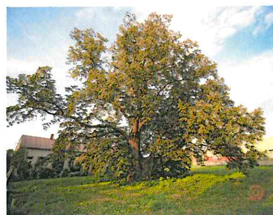
Pomnik przyrody: 700 - letnia lipa rosnąca na terenie przykościelnym w Pajęcznie