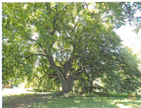
Pomnik przyrody: 700-letnia lipa drobnolistna rosnąca w parku dworskim w Siemkowicach fot. Wojciech Beška