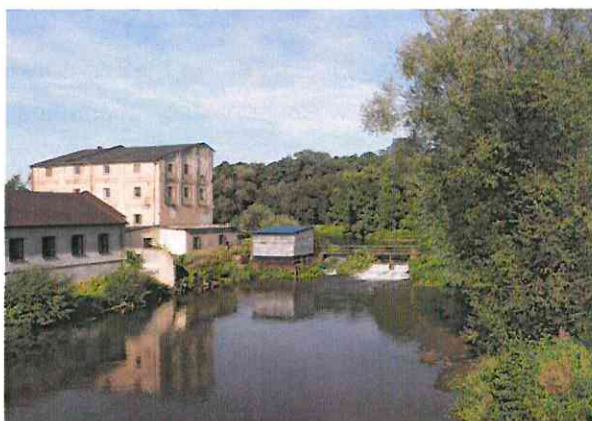
Elektrownia wodna na rzece Warta w miejscowości Działoszyn

Najważniejsze z nich przedstawia tabela poniżej: