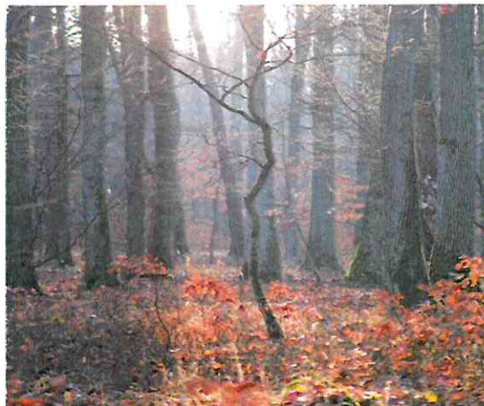
Rezerwat przyrodniczy „Dąbrowa w Niezankowicach”