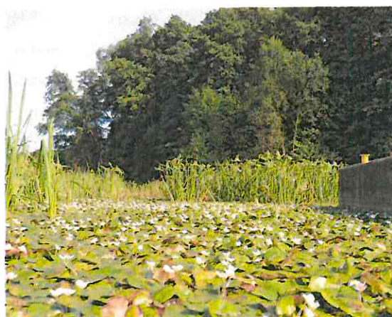
Pomnik przyrody: „Zabi Staw” w miejscowości Bobrowniki